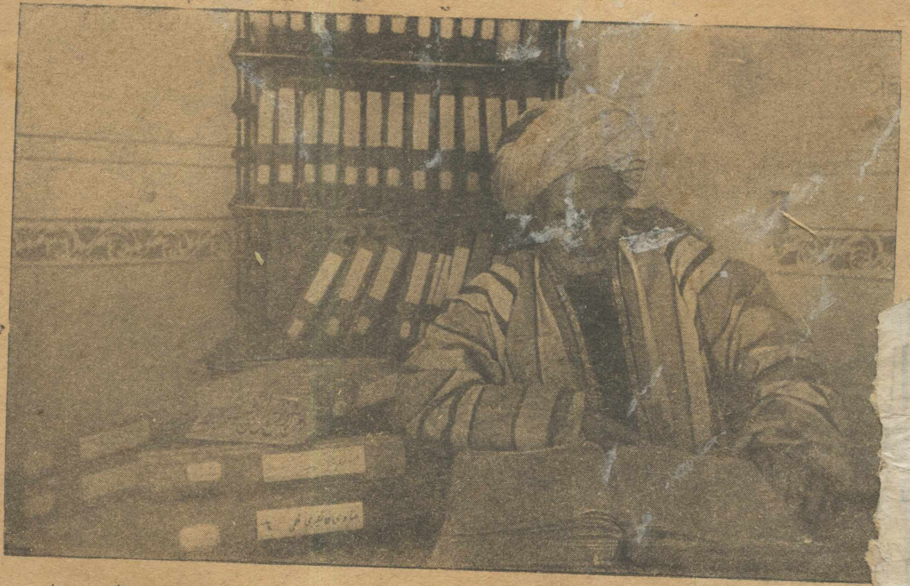
اورتا آسيا و قازاغستان مسلمانلرى دىنيه نظارت رئيسى مفتى ايشان باباخان بن عبدالمجيدخان